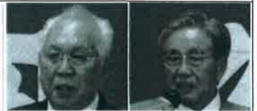
春駒交通労組 品川委員長