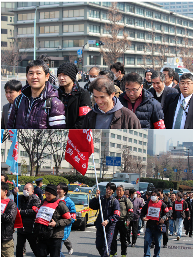
(左写真)A出番の方が参加して頂いた「ハイタクフォーラム2013総決起集会」