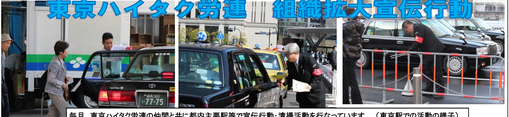
毎月、東京ハイタク労連の仲間と共に都内主要駅等で宣伝行動・清掃活動を行なっています（東京駅での活動の様子）